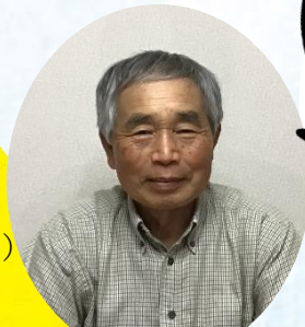
九州ブロック 本部理事

③自身のSNS（フェイスブック・ ツイッター・インスタグラム）・ ホームページに投稿。