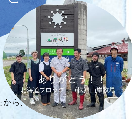
ありがとう！！ 北海道ブロック (株) 山岸牧場