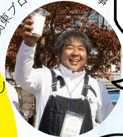
関東ブロック 加茂理事

酪農家がみんな大変な 今だからこそ、感謝の気持ちを忘れ ずにいたいと思っています！ エサ屋さん、機械屋さん、 獣医さん、行政…それぞれの 立場で支えてくださっていると 思います。 何より、お金を出して牛乳 を飲んでくださるたくさんの 消費者の方に、年に一度、 私達みんなで「ありがとう」を 言ってみませんか？ ご協力よろしく お願いいたします