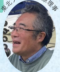
東北ブロック 原理事

皆さんの心に飼っている「ありがとう」をデビューさせませんか？数えきれない人たちの手で支えられつなげられてる酪農。年に一度！みんなで！一斉に！「ありがとう」を表舞台にデビューさせましょう！